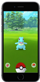
FIGURE 1 – Illustration du jeu Pokémon GO

Le jeu pour smartphone Pokémon Go reprend l'univers du manga éponyme. Il utilise la réalité augmentée pour donner une expérience utilisateur nouvelle.